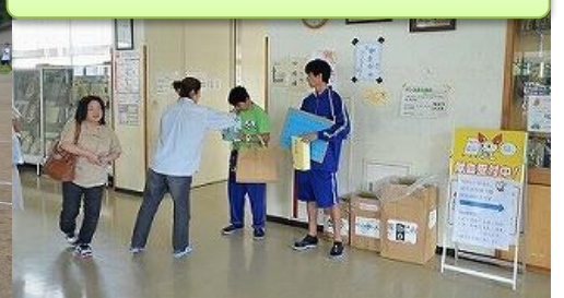
募金活動、ありがとうございます