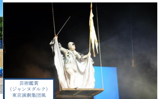
芸術鑑賞 (ジャンヌダルク) 東京演劇集団風