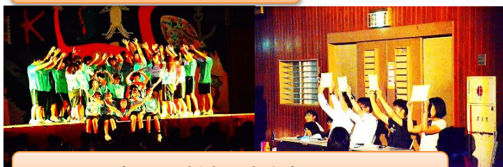
クラス別ダンス、採点の先生方