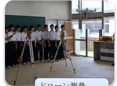
ドローン測量 ・建設実習 ・(土木・建築)