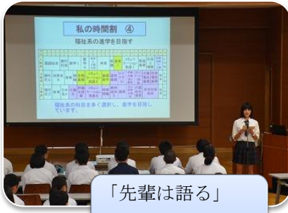
「先輩は語る」 ・私の時間割 ・(全体説明会)

本校では体験入学を7/27(土)午前中に実施しました。長野県中野立志館高等学校の様子を知ってもらえる良い機会でした。中学生の参加人数は160名以上来ていただきありがとうございました。