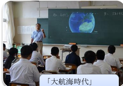
「大航海時代」 ・コロンブスとアメリカ大陸発見 ・(地歴公民)