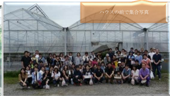
ハウスの前で集合写真