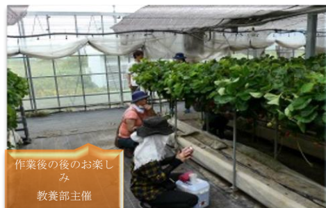
作業後の後のお楽しみ 教養部主催