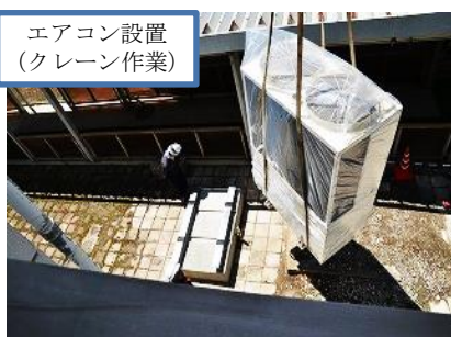
エアコン設置 (クレーン作業)

6月7日が雨天のため、6月14日に学年対抗クラスマッチが行われました。第一体育、第二体育館、グラウンドを使って、クラス全員が試合に出られるように、チーム編成をしました。総合優勝は、3年C組、F組が同点のため2クラス優勝でした。