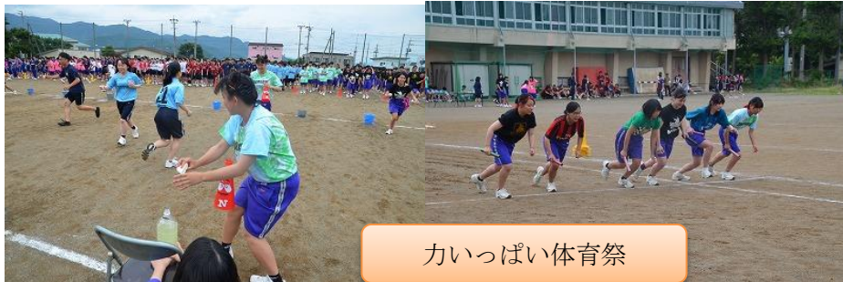
かいっぱい体育祭