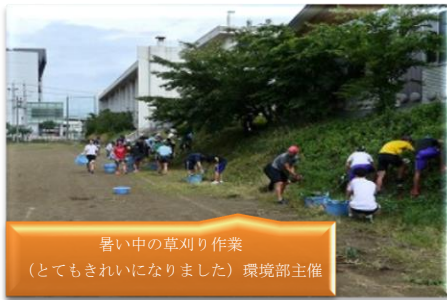
暑い中の草刈り作業 (とてもきれいになりました) 環境部主催