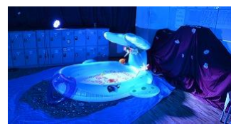
クラブ・クラス展示