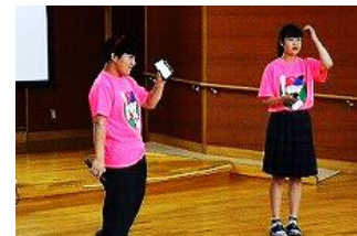
うたうま（カラオケ大会）